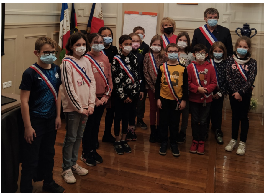
Installation du Conseil Municipal des Enfants 2021-2022

Plusieurs projets seront menés dont vous trouverez le détail de leur avancement à l'intérieur...