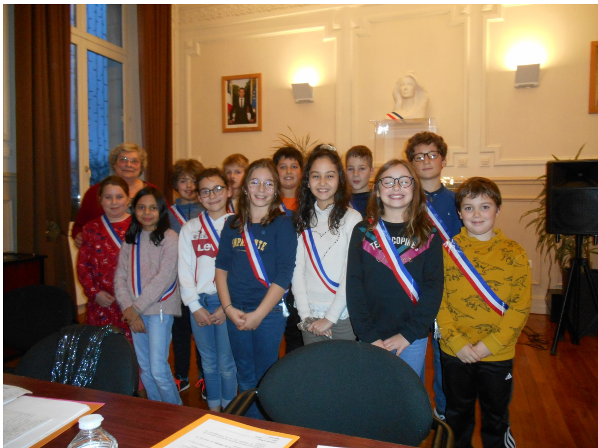
Installation du Conseil Municipal des Enfants 2019-2020

Plusieurs projets seront menés dont vous trouverez le détail de leur avancement ci-contre...