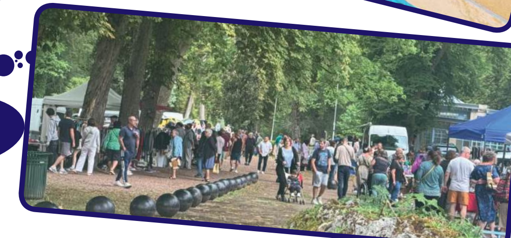
Brocante d l'ACAP