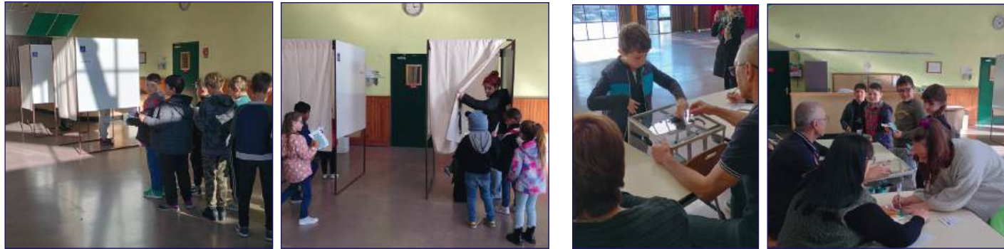
Attente devant les isolements

Retour en images sur cette journée : Les classes ont été accueillies tout au long de la matinée, le dépouillement a eu lieu dans la foulée.