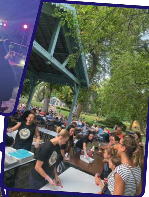
Belles linguistiques to l'été