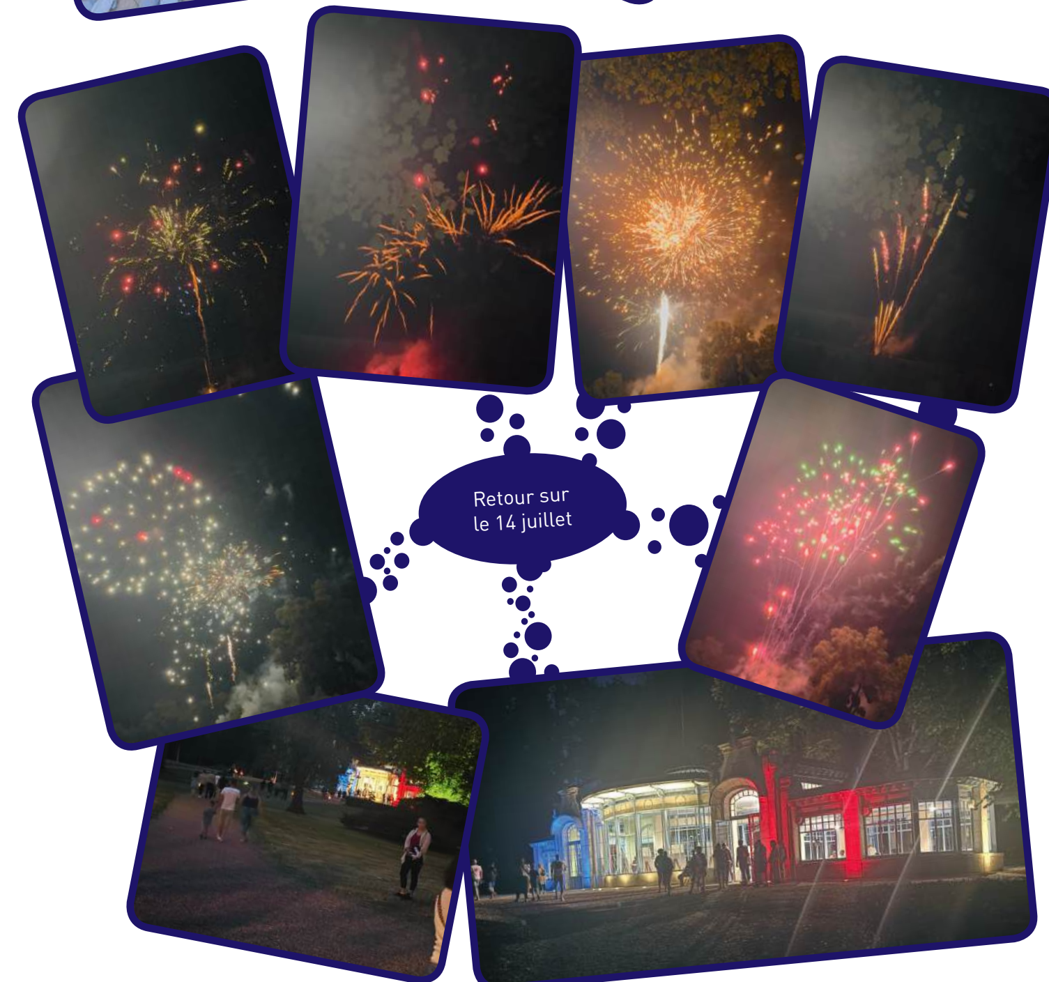
Retour sur le 14 juillet