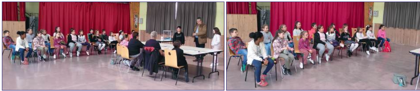
Explications de la méthode de dépouillement