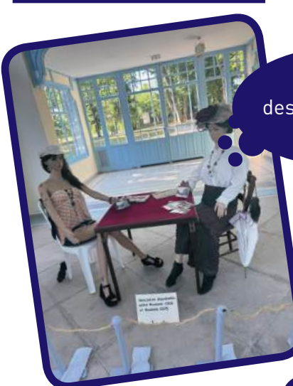
Exposition des amis du vieux Pougues