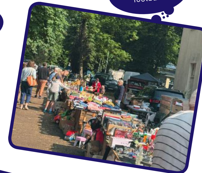
Brocante du football